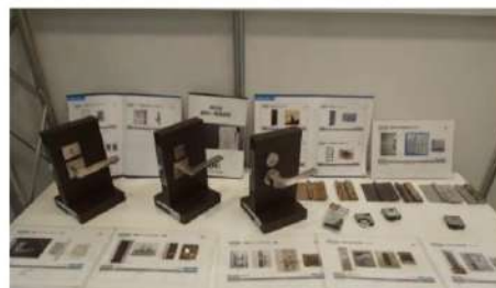
※画像は、2019年8月開催したイベントの様子

そして、「Cjk部材」をはじめとした部材・部品をどのタイミングで交換したらいいか、どのようなメンテナンス方法があるのかなど、大手住宅メーカー・建材メーカー・設備メーカーの専門家が、パネルをご覧くださいながら、丁寧にアドバイスをさせていただきます。