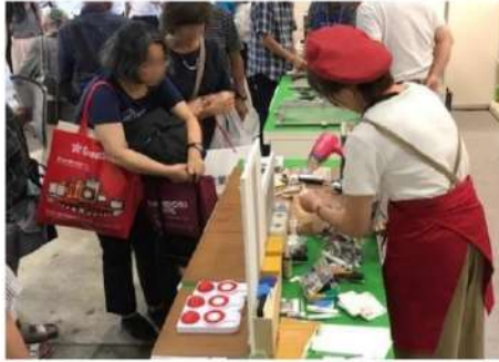
※画像は、2019年8月開催したイベントの様子

なお、一般PRデーとなる8月30日（金）、8月31日（土）の2日間は、DIYアドバイザーなどによるメンテナンス実演ショーを開催します。是非、お立ち寄りください。